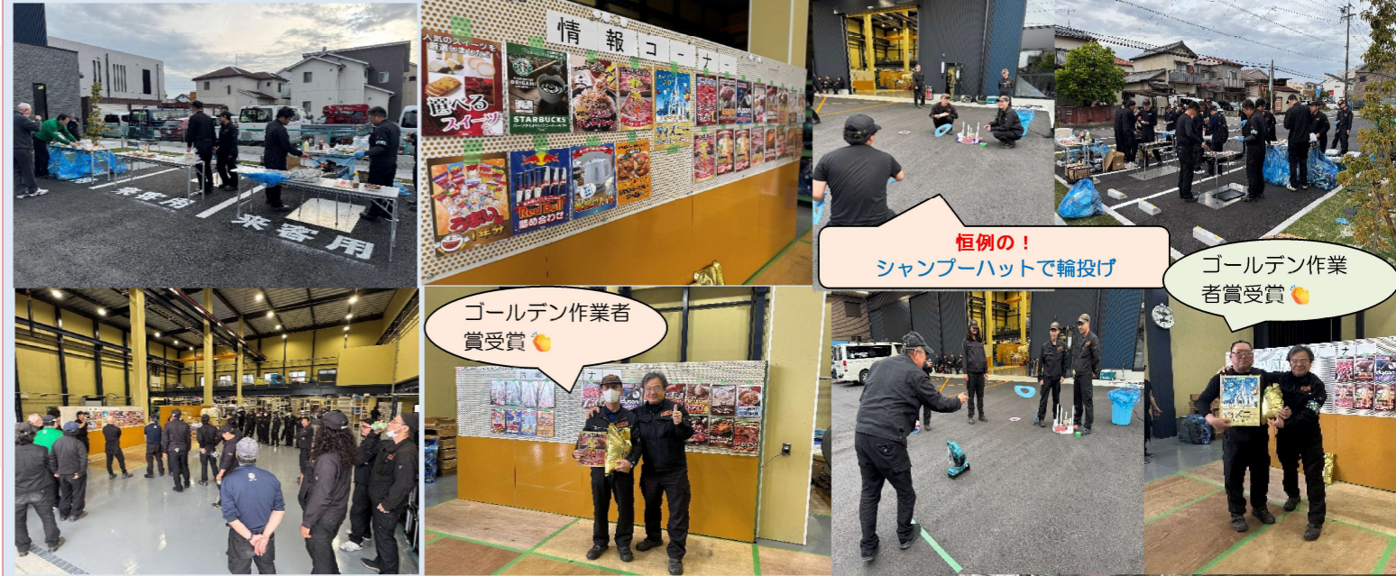
恒例の! シャンパーハットで輪投げ ゴールデン作業賞受賞